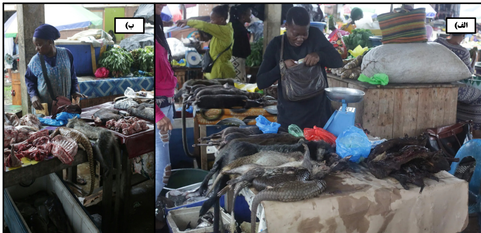
شکل ۴. از سرگیری تجارت حیات وحش در بازارهای محلی گابن ۱

کاریماتیک ۲ و خاص مانند کرگدن، ببر و فیل متمرکز شده و غالباً از پیچیدگی معادله بازیگران، شبکه‌ها و اثرات این موضوع غافل می‌شوند [۹۳]. این موضوع به عنوان بحرانی چالش برانگیز در حفاظت، توجه بین‌المللی و حمایت حامیان محیط زیست را به خود جلب کرده است [۳۴، ۹۴، ۹۵، ۹۶ و ۹۷]. به خصوص اینکه بازار عظیم تجارت غیرقانونی حیات وحش پیامدهای امنیتی بی‌ثبات‌کننده زیادی برای جوامع به همراه دارد و با همکاری و نقش‌آفرینی گروه‌های شورش‌محور مسلح، جنایات سازمان‌یافته محلی و جهانی زیادی را رقم می‌زند [۹۸] و با انتقال حیوانات از مجاری مختلف خشکی، آبی و هوایی که می‌توانند به صورت بالقوه عامل بیماری یا یکی از حلقه‌های انتقال آن باشند [۷۶ و ۹۹] خطرآفرین است. این موضوع با همه‌گیری ویروس کرونا در سال ۲۰۱۹ [۳۰] و کشف منشأ حیوانی آن از خفاش‌ها دوباره در سطحی گسترده توجه عمومی را به خود جلب و پژوهشگران، سیاست‌گذاران و مسئولان را با پرسش‌ها و چالش‌های متعددی مواجه کرد.