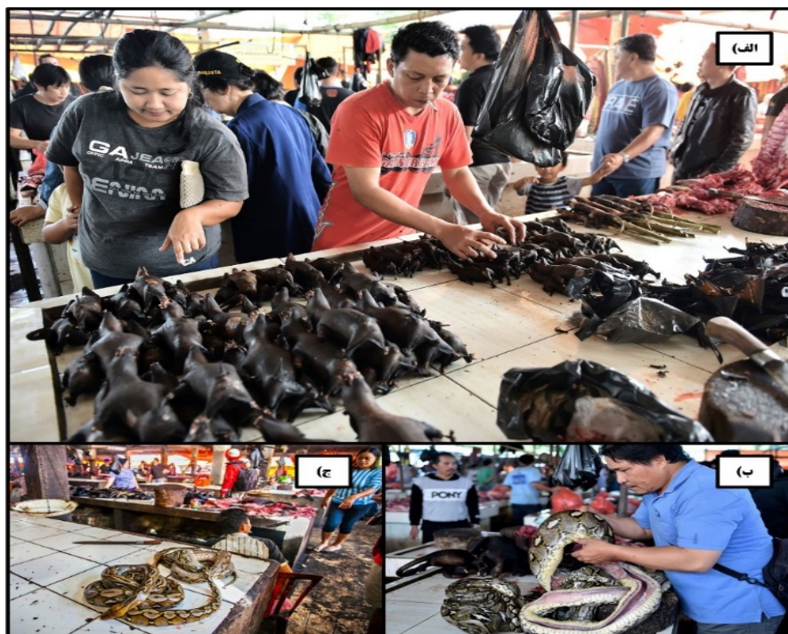
شکل ۳. از سرگیری تجارت حیات وحش در بازارهای محلی اندونزی

۱. جمهوری گابن کشوری واقع در غرب آفریقای مرکزی است.