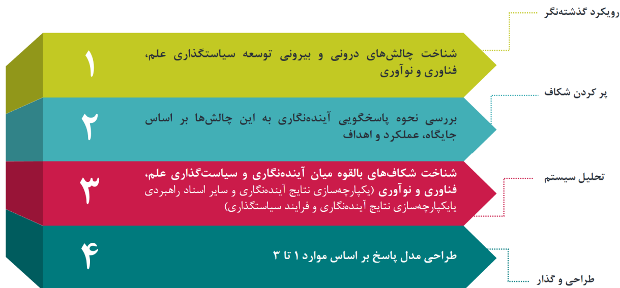
شکل ۲. گام‌های کلیدی هم‌فاز نمودن آینده‌نگاری و سیاست‌گذاری علم، فناوری و نوآوری