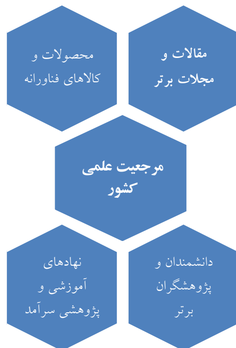
شکل ۱. ابعاد مرجعیت علمی از نظر اسناد بالادستی

بر این اساس، سطوح مرجعیت علمی را می‌توان در قالب شکل ۱ به تصویر کشید (Azadi Ahmadabadi, 2023).