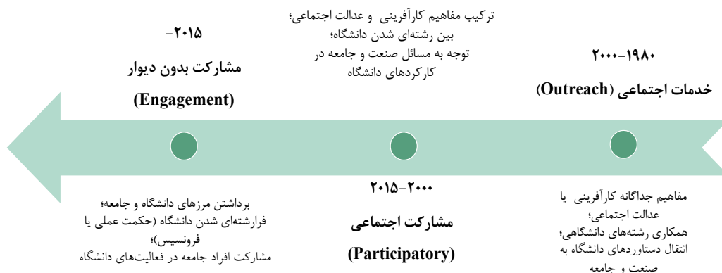
شکل ۲. سیر زمانی تحول مفهوم مسئولیت اجتماعی دانشگاه