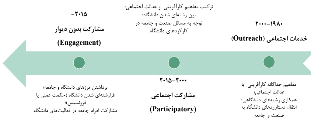
شکل ۲. سیر زمانی تحول مفهوم مسئولیت اجتماعی دانشگاه